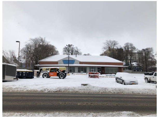
IDENTIFIER: 204 W Utica