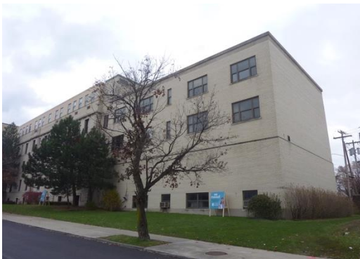
IDENTIFIER: MH Building