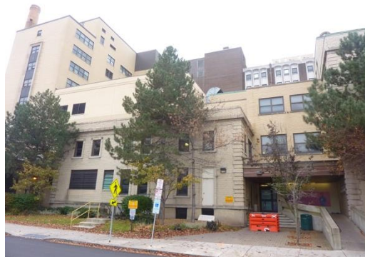
IDENTIFIER: C Building